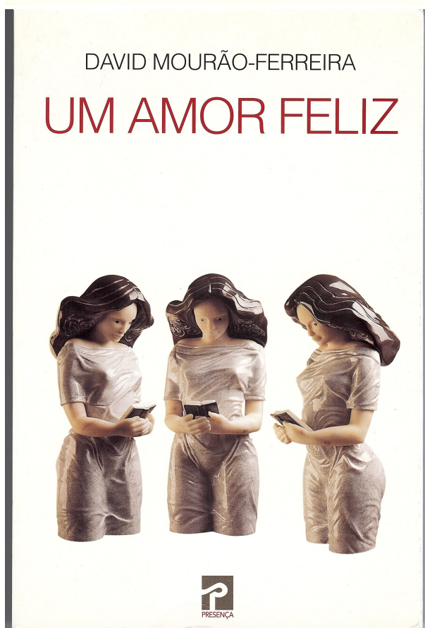
Um Amor Feliz , 11 a ed., 1996